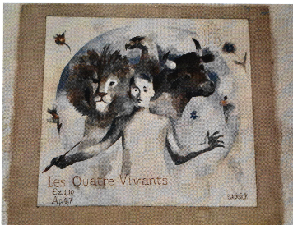
Fresque « Les 4 Vivants » réalisée par Gilles SACKSICK dans notre église . Son talent n'est plus à démontrer et il laisse son empreinte pour notre commune.